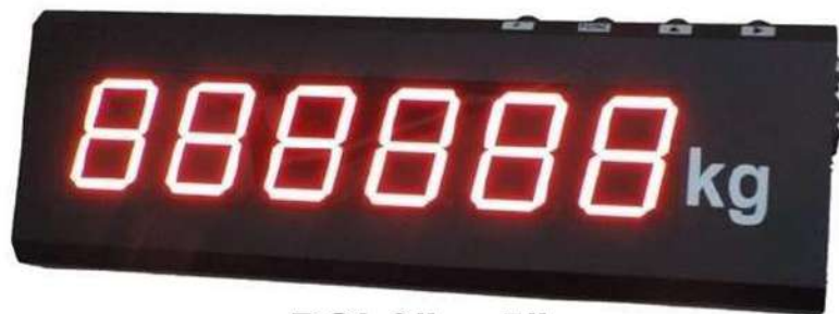
BSI 3" ~ 5"